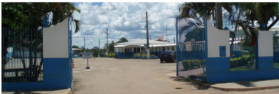
Entrada da CASA DOM INÁCIO